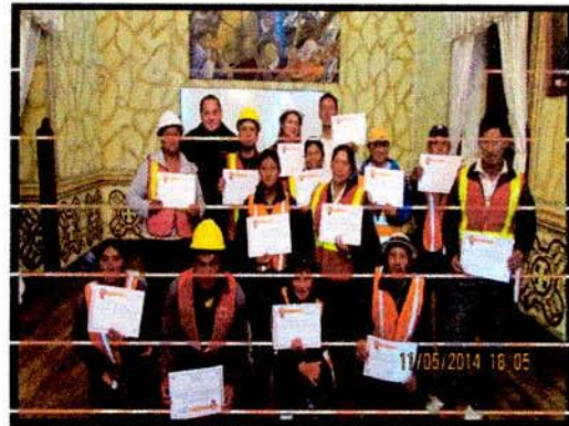
Foto 2. Equipo de trabajo de barrido