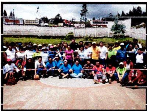
Foto 5. Integración del personal