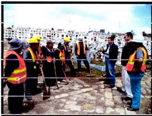
Foto 3. Trabajo en feriados