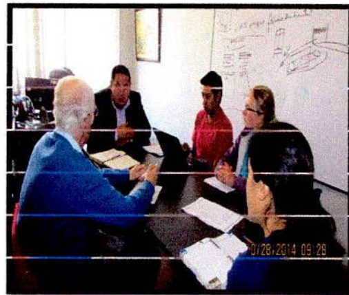
Foto 7. Reuniones de la Mancomunidad