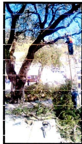
Fotos 9, 10, 11. Varias actividades.