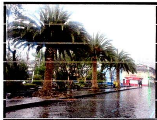
Foto 4. Poda de palmeras de la ciudad